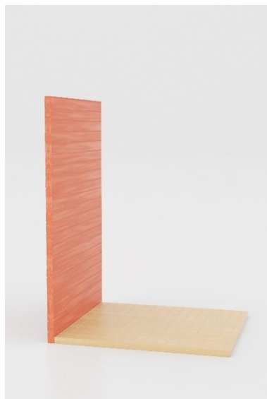
2. Desna stranica