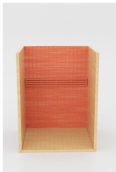
4. Stražnja ploča