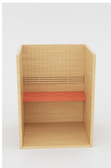
5. Gornja klupa