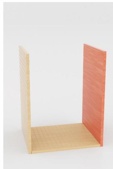
3. Lijeva stranica