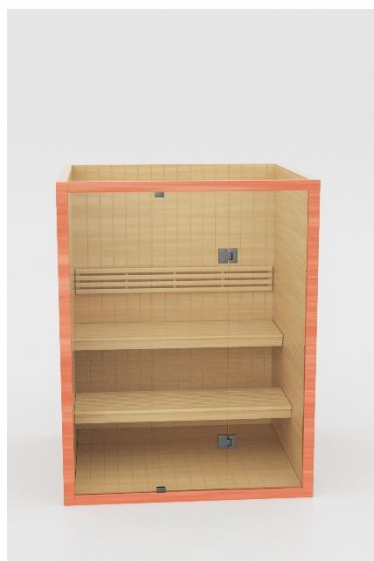
7. Prednja strana sa staklom