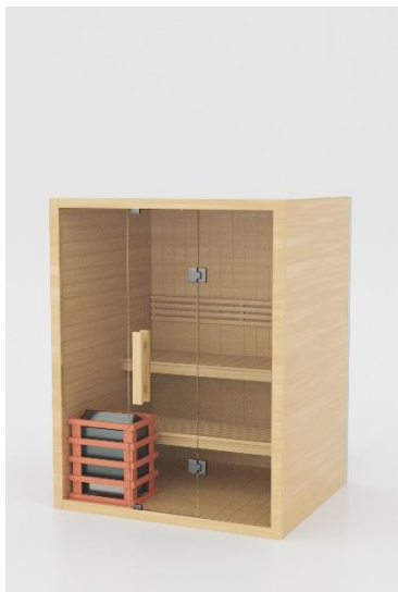
10. Peć i okvir peći