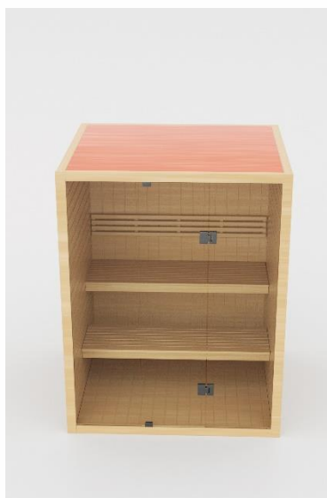
8. Stropna i pokrovna ploča