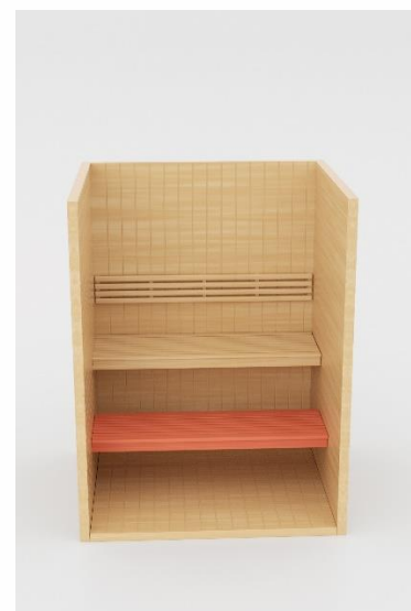
6. Donja klupa